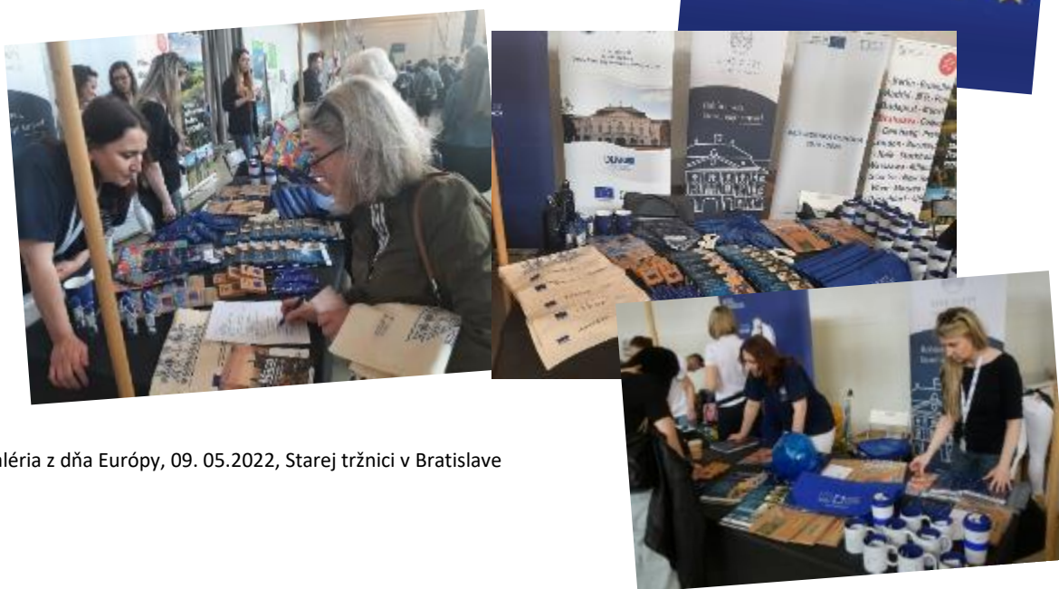
Fotogaléria z dňa Európy, 09. 05.2022, Starej tržnici v Bratislave